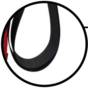
CINTAS DE AJUSTE