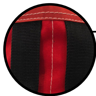
CINTAS DE AJUSTE